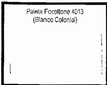
Paleta Focoltone 4013 (Blanco Colonial)